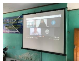
Gambar 2. Penyampaian materi

Dokumentasi pelaksanaan pengabdian kepada masyarakat: